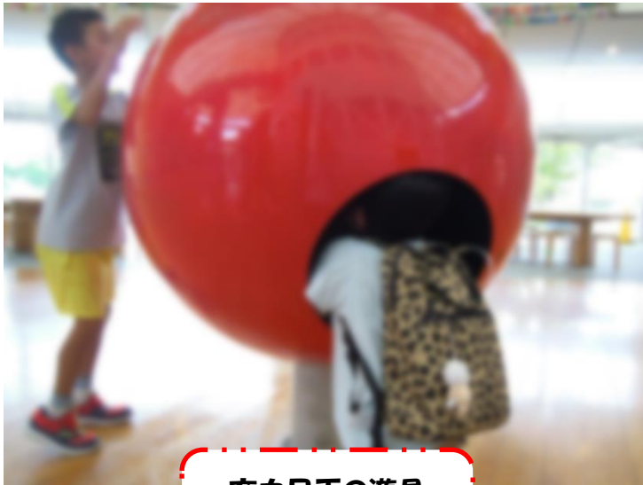
充血目玉の遊具 ※正式名称不明