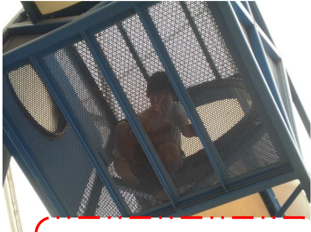
青い網の上でピースをしているのは 誰でしょうか？