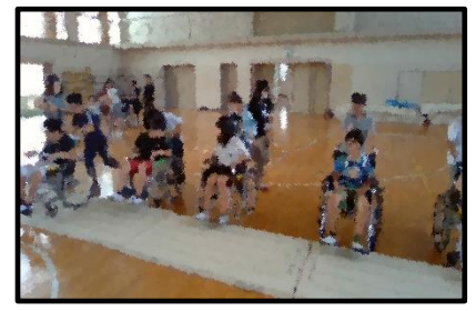
【介助体験や車いす体験の様子】

5年生では、「福祉」をテーマにして、特別支援教室の先生の講話や視覚障がい者、肢体不自由の方と出会い、日常の生活の様子を聞いたり、介助する体験をしたりしました。また、障がいがあっても世界で活躍しようと努力するパラリンピック選手とも対談し、苦勞だけでなく、様々なことを前向きに考える大切さも学びました。