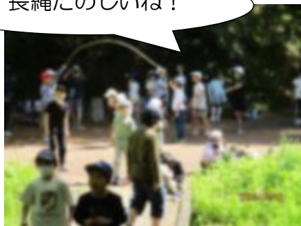
【自然の中で、仲良く遊びました】