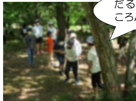
【4年生がいろいろな遊びを考えてくれました】