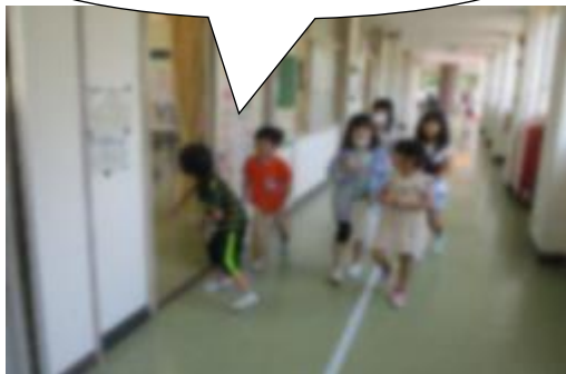
【学校マップを見ながら案内しました】

1年生とペアになって、学校の中を案内しました。上級生として思いやりをもって接することを意識しながら、事前にどの教室を紹介するか考えたり、どんな言葉で説明するか練習したりしました。